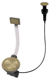
Vidange automatique Space Push Gold